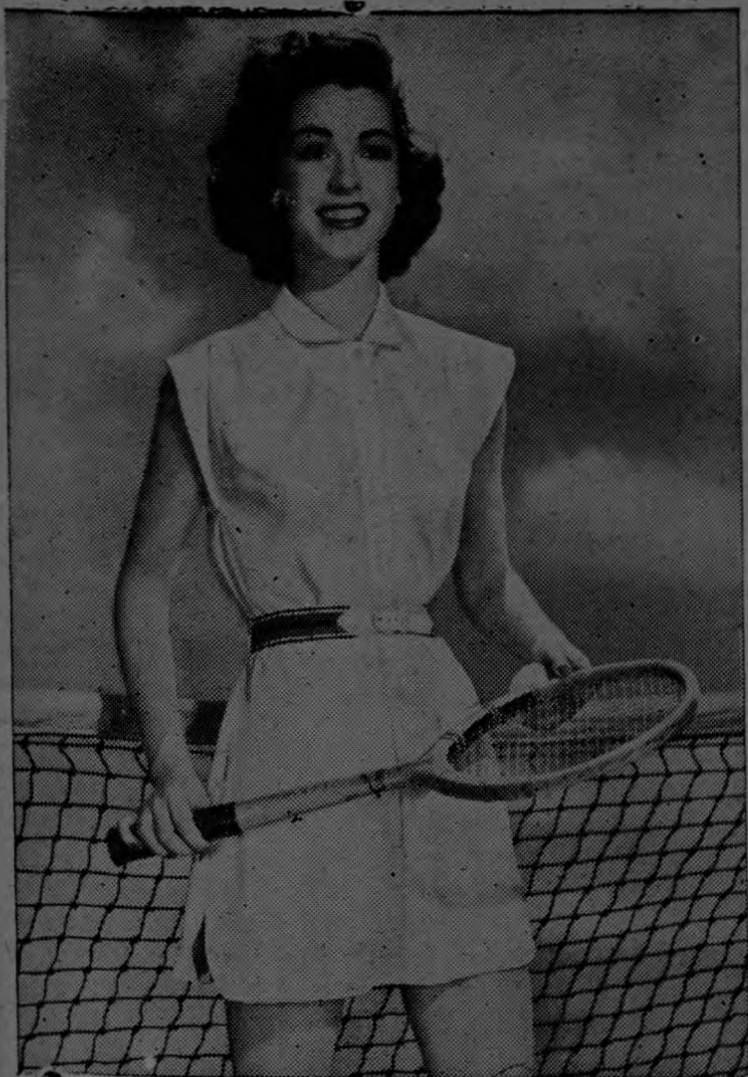
Marsha Hunt, actriz de la Metro-Goldwyn-Mayer, lista para una partida de tenis.